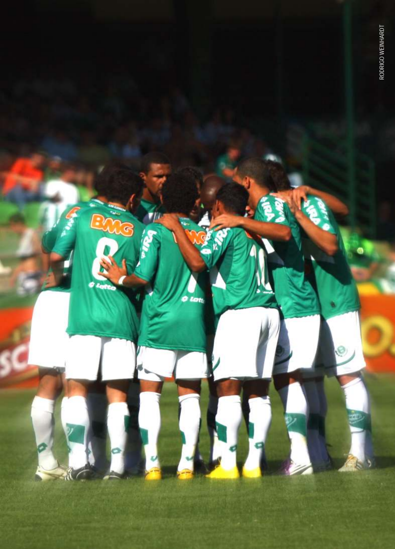
JOGADORES REUNIDOS ANTES DA PARTIDA CONTRA O GUARATINGUETÁ, NO COUTO PEREIRA.